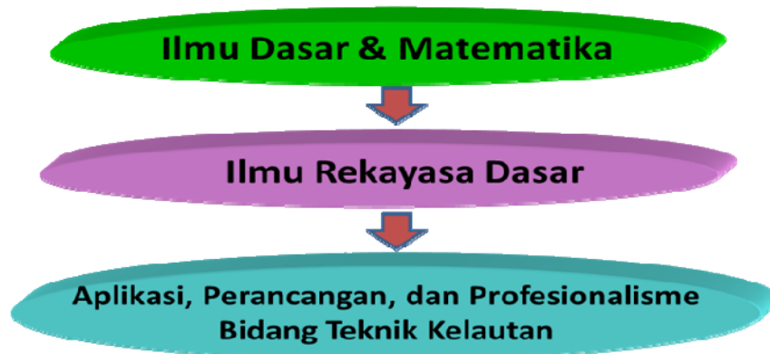
Gambar 1 Body of knowledge Program Studi Sarjana Teknik Kelautan

Dengan pembekalan keilmuan tersebut, lulusan pendidikan Program Sarjana Teknik Kelautan diharapkan mampu menguasai ilmu dasar untuk dapat terjun dalam dunia kerja ataupun mengikuti pendidikan lanjut melalui penguasaan tingkatan penguasaan ilmu yang menonjol berupa knowledge yang diikuti oleh comprehension , application , dan analysis . Tabel 1 di bawah ini menggambarkan tingkatan penguasaan ilmu dari program sarjana dibandingkan dengan program magister Teknik Kelautan.